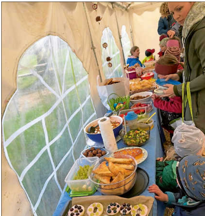
Das leckere Büfett