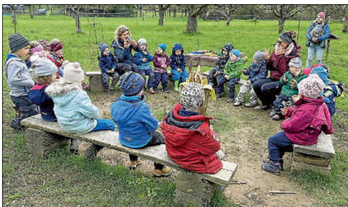
Das kleine Häschen Löffelohr

Nach dem Impuls zu Beginn des Seniorenkreises haben wir wieder Zeit für gute Gespräche bei Kaffee und Kuchen.