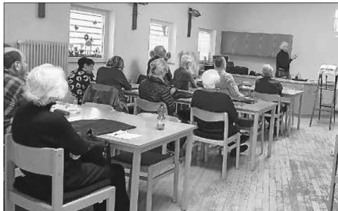
Letzter Workshop Smartphone

Die Themen bestimmen mehr oder weniger die Teilnehmer durch ihre Fragen.