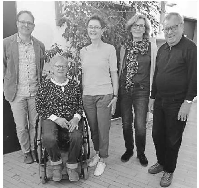
Vorstand Hospizdienst RHL