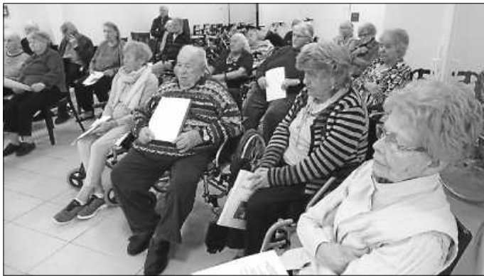
Sehr gut besuchter Gottesdienst im Andachtsraum

Der dienstägliche Gottesdienst ist eine der wenigen Veranstaltungen, die im ATS gemeinsam, das heißt wohnbereichsübergreifend, stattfinden. So ließen es sich sehr viele Bewohner*innen nicht nehmen, sich zu diesem Gottesdienstangebot zu begeben. Sie sorgten mit ihrem Gesang und Beten für einen würdigen Rahmen. Der Höhepunkt war natürlich das Abendmahl.