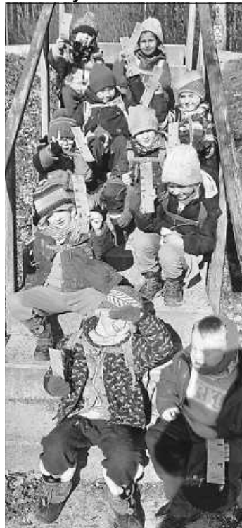
Die fleißigen Vorschulkinder