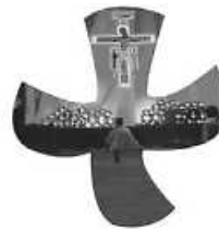
Logo: Jürgen Schneider