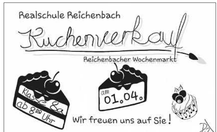
Plakat: Klasse 8a

Kuchenverkauf der Klasse 8a auf dem Wochenmarkt am 01.04.2023, 08.00 Uhr