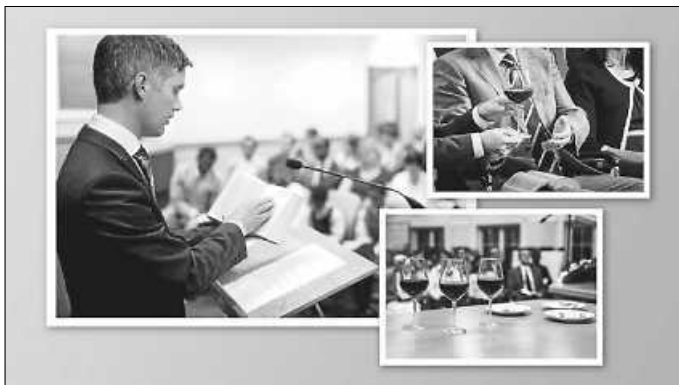
Abendmahl zum Gedenken an Jesu Opfer

Wir sind sehr dankbar und fühlen uns überaus geliebt.