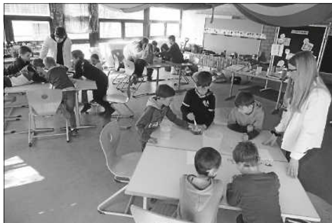
Hochkonzentriertes Arbeiten im GTS Natur Labor

bauten einen XXI Weidentunnel, bepflanzten unser Hochbeet mit Samen und Setzlingen und bauten dann auch noch eine große Vogelscheuche, die nun über die kleinen Pflänzchen wacht. Bleibt nur zu hoffen, dass die Sonne, Regen und auch ein grüner Daumen unsere Bemühungen belohnen. Am Ende der Ferienwoche waren sich alle einig: jetzt kann der Frühling endlich kommen!