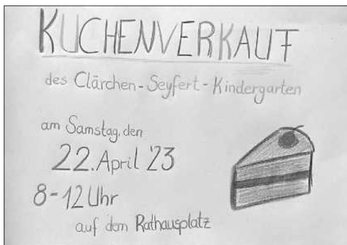
Plakat: St. Hübel