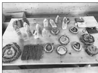
Wer sucht, der findet! Einige entstandene Werkstücke

Während des Festes erklangen immer wieder fröhliche Kinderlieder zu Ostern, bei denen alle Anwesenden mitsangen. Zum Abschluss des gelungenen Vormittages fand die traditionelle Osternestsuche statt, bei der die Kinder mit leuchtenden Augen ihre Schokoladenhasen und bunt gefärbten Eier suchten und fanden.