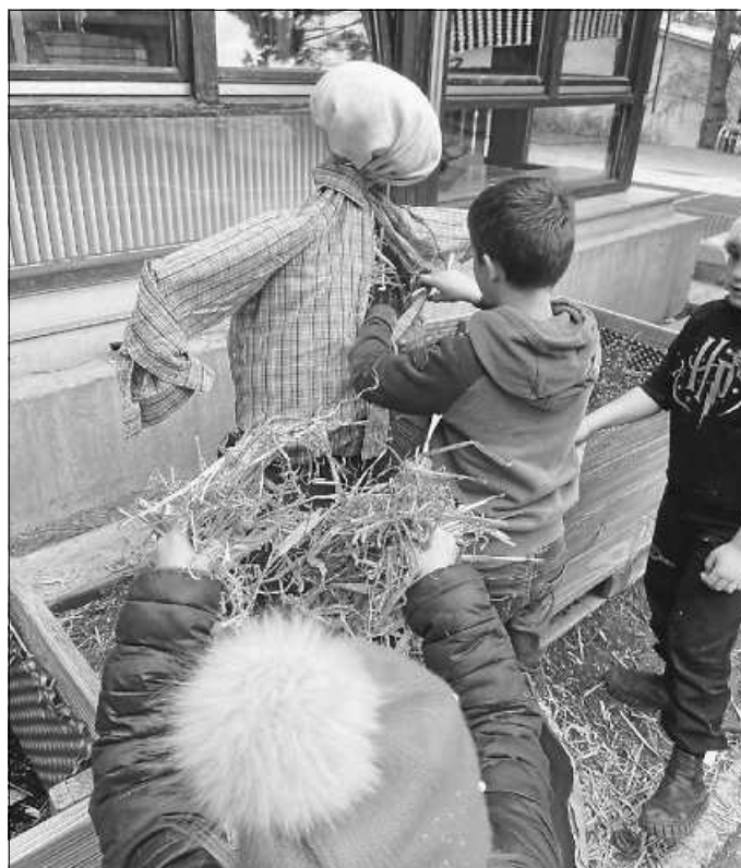
Die Vogelscheuche wird gut ausgepölkert