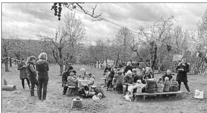
Auf der Festwiese