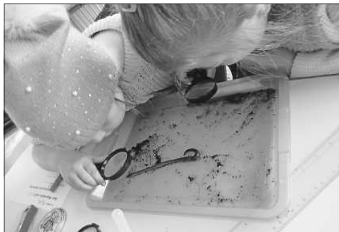
Der Regenwurmworkshop erfordert ein klein wenig Mut