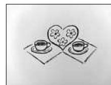
Logo: M. Ehrenfeuchter