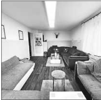
Eines unserer Zimmer

Jugendhaus Öffnungszeiten: Montag - Freitag, 15:00 – 21:00 Uhr