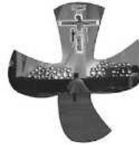
Logo: Jürgen Schneider

Im Mai können wir gleich zu zwei ökumenischen Taizé-Gebeten einladen: zunächst und im Rahmen der Begegnungs- und Gebetswoche am Freitag, 5. Mai, 19:00 - 19:45 Uhr