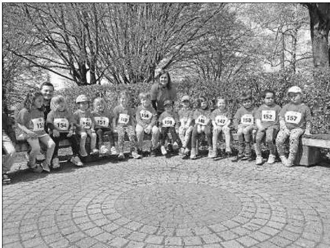
Die stolzen Kinder und betreuenden Kräfte vor dem Lauf :-)

Am 23.04.2023 trafen sich die Fitness-Kids vom Kinderhaus Kunterbunt bei schönstem Wetter in Lichtenwald zum alljährlichen Bambinilauf des LIWA-LaufEvents.