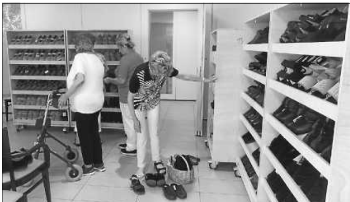
Mobiler Schuhverkauf mit großer Auswahl

Wann? Am Mittwoch, 24. Mai 2023, 14:00 Uhr – 16:00 Uhr . Wo? Im ATS .