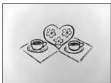
Logo: M. Ehrenfeuchter

Sie haben sich zum Ausflug am Grafik: Images Mittwoch, 17.05.2023, angemeldet und dazu hier noch eine wichtige Information. Wir bitten Sie, unbedingt um 09:15 Uhr an der Abfahrtsstelle in Reichenbach, Brühlhalle/Pilz zu sein , damit wir dann pünktlich um 09:30 Uhr losfahren können.