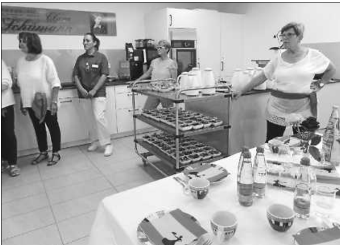
Viele haupt- und ehrenamtlichen Mitarbeitende kümmern sich um das Wohl der Gäste