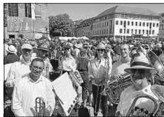
Foto vom Landesposaunentag am 25.06.2023 in Ulm