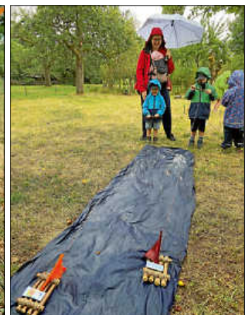
Dranbleiben lohnt sich!