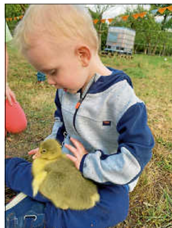
Beim Streicheln der Küken