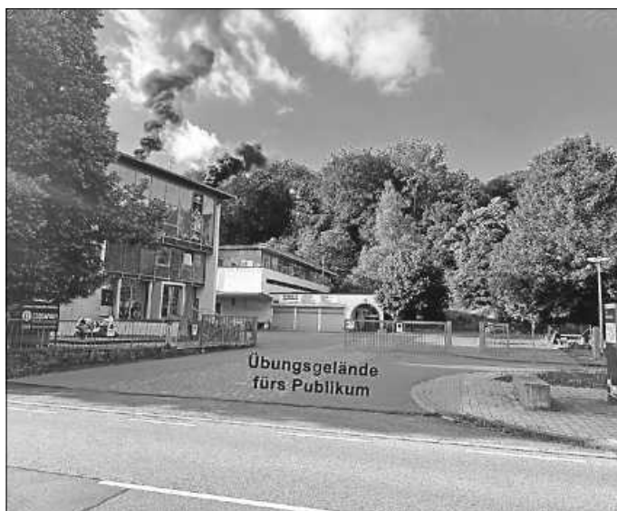
Auf diesem Gelände können Sie die Übung um 17 Uhr verfolgen

Unser anschließendes Fest erreichen Sie fußläufig innerhalb 5 Minuten vom Übungsobjekt.