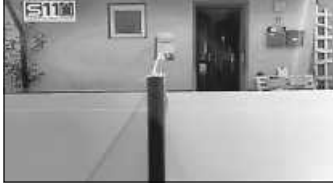
Tischtennisplatte vor dem Jugendhaus

Ein Freiwilliges Soziales Jahr ist bei uns für den Zeitraum vom 01.09.2024 bis 31.08.25 noch möglich. (39 Std./Woche; 25 Seminartage; 355 €/Monat Vergütung; direkte Anleitung im Jugendhaus) Bei Interesse anrufen oder einfach vorbeischaun. 29.7.-2.8.24 action! Filmferienprogramm ab 12 Jahren Deine Möglichkeit einen eigenen Film zu drehen und dabei alles, was vor und hinter der Kamera passiert kennenzulernen. Bei passendem Wetter holen wir unsere Tischtennisplatte heraus, die alle benutzen dürfen. Schläger und Bälle haben wir auch vor Ort.